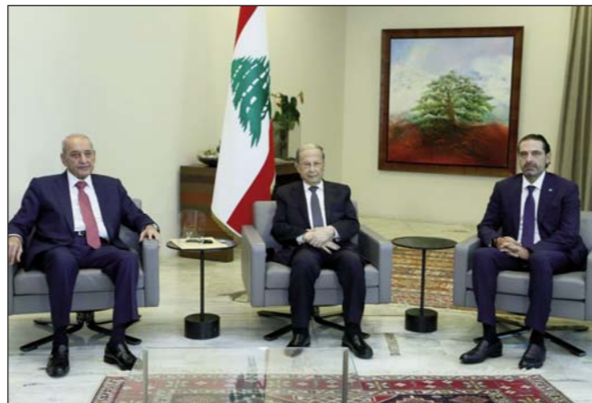
արագ ժամանակամիջոցին կազմել, որովհետեւ անկիւ մեր երկրին համար առկայ միակ է վերջին առիթն է», ըսաւ ան:

Միւս կողմէ, հակառակ Պաապտայէն իր բացակայութեան, երեսփոխան Ատնան Թրապուլսի առաջադրած էր Սաստ Հարիրի թեկնածութիւնը: