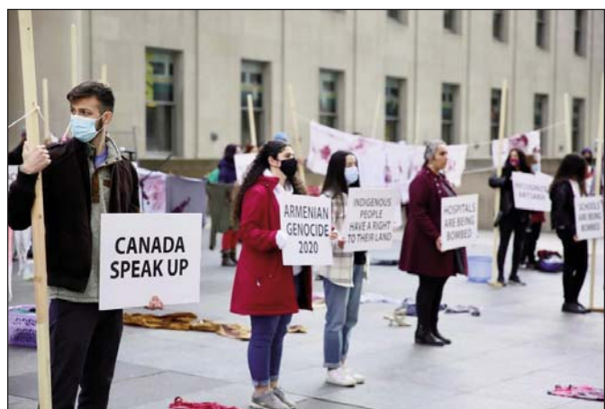
«Ձանատա՛ւ, խօսէ՛. Թորոնթոյի մէջ հայերը լուռ ցոյց կազմակերպած են

Ան ըսաւ, որ հիմնականին մէջ թշնամիի փոքր խումբերը կը չեզոքացուին օճախային մարտերու մէջ: