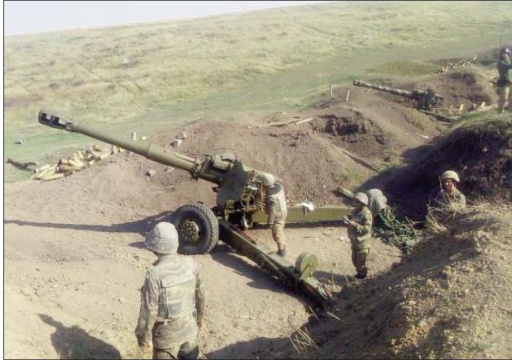
Շար.ք՝ էջ 4

Պատերազմին ընթացքին Արցախի պաշտպանութեան բանակը շուրջ 1 տասնեակ «Պայրաքտար» թրքական անօդաչու թռչող սարքեր խոցած է: Այս մասին Դիմատետրի իր էջին գրած է Հայաստանի վարչապետ Նիկոլ Փաշինեան: «Տնօրնած սարքերէն ոչ մէկը, սակայն, պաշտպանութեան բանակի վերահսկողութեան տակ գտնուող տարածքներուն մէջ ինկած է: Կարծես վերջապէս «Պայրաքտար»-ի բեկորներ ունիւք, որմէ անկայտ կը դառնայ, որ անիկա արտադրուած է սեպտեմբերին, իսկ գերծամանակակից տեսախցիկը Զանաշայի մէջ արտադրուած է յուլիսին, յայտնած է ան: Շատ վարչապետին, ասիկա կը փաստէ Թուրքիոյ անմիջական ներգրաւածութիւնը Արցախի դէմ մղուող ահաբեկչական պատերազմին եւ անոր նախապատրաստութիւններուն մէջ: «Եւ այն երկրները, որոնք «Պայրաքտար»-ի անհրաժեշտ բաղադրամասեր կը մատակարարեն Թուրքիոյ՝ այս փաստին բերումով պէտք է հետեւին Զանաշայի օրինակին եւ կասեցնեն հետագայ մատակարարումները», գրած է Փաշինեան: Իսկ Թուրքիոյ իր էջով Հայաստանի վարչապետ Նիկոլ Փաշինեան դիտել տուաւ, թէ Մարդու իրաւունքներու երրօրական դատարանը հաստատած է, որ Ազրայեճան կը ղեկավարուի ցեղապաշտական իշխանութեան կողմէ, որ կը փառաբանէ հայերու նկատմամբ ցեղային թնուութիւնները եւ ցեղային ատելութիւն կը սերմանէ հասարակութեան մէջ: «Արցախի հայերուն Ազրայեճանի իշխանութեան ներքեւ ապրիլ պարտադրելը կը խախտէ միջազգային իրաւունքը», գրած է վարչապետ Փաշինեան: Արցախի Հանրապետութեան նախագահ Արայիկ Յարութեանեանը 20 հոկտեմբերին ընդունած է Հայաստանի Ազգային ժողովի «Իմ քայլը» խմբակցութեան պատգամաւորները՝ Ազգային ժողովի նախագահ Արարատ Միրզոյեանի գլխաւորութեամբ: