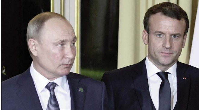
Շար.ք՝ էջ 2

Ռուսիոյ նախագահ Վլատիմիր Փութին եւ Ֆրանսայի նախագահ Էմանուէլ Մաքրոն հեռաձայնային զրոյց ունեցան մանրամասն կերպով քննարկելով Լեռնային Ղարաբաղի տագնապի գոտիին մէջ զարգացող իրավիճակը: