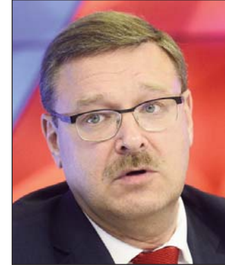
Շար.ք՝ էջ 2

Ռուսիոյ Դաշնակցային խորհուրդի միջազգային հարցերով յանձնախումբի ղեկավար Զոնսթան Քոստաչուկ յայտարարած է, որ Լեռնային Ղարաբաղի տագնապին մէջ սուրիացի զինեալներու մասնակցութեան հարցով Հայաստան պէտք է պաշտօնապէս դիմէ Ռուսիոյ՝ շրջանին մէջ ռուսական կողմի հակահաբեկչական գործողութիւններու կատարման համար: Այս մասին կը հաղորդէ «Ի.Էյ.տել» կայքը: