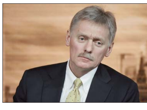
Շար.ք՝ էջ 2

Ռուսիոյ նախագահի մամլոյ քարտուղար Տիմոթի Փետրով յայտարարած է, որ Հայաստանի եւ Ազրայեճանի միջեւ զինուորական գործողութիւնները դարձնելու նպատակով ի գործ դրուած աշխատանքները կը շարունակուին: Այս մասին կը հաղորդէ ԹԱՍՍ լրատու գործակալութիւնը: