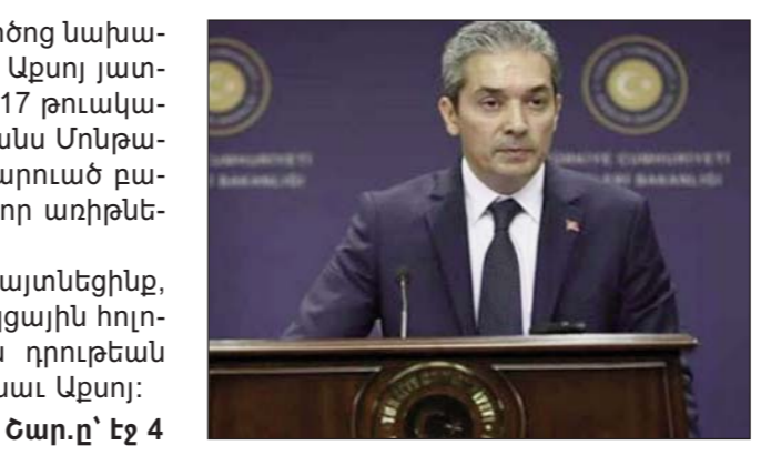
Շար.ը՝ էջ 4

Թուրքիոյ արտաքին գործոց նախարարութեան բանբեր Համի Աքսոյ յայտնեց. «Յունական կողմը 2017 թուականի զուլիցեղիական «Քարանս Մոնթանա» համալիրին մէջ զումարուած բնակցութիւններուն մէջ բոլոր առիթները կորսնցուց»: «Մենք իրապարակաւ յայտնեցինք, թէ այսուհետեւ նոր բնակացային հոլովոյթին մէջ դաշնակցային դրութեան մասին պիտի չխօսուինք», ըսաւ Աքսոյ: