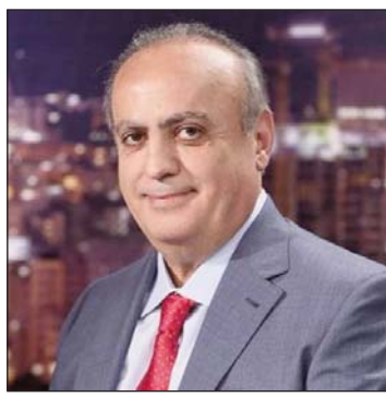
Ռուստամ Ռահապ ընկերային ցանցերուն ընդմեջէն կատարած իր յայտարարության մեջ յայտնեց...