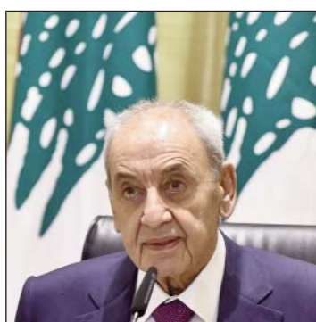
Նեայիի ՊԸՐՐԻԻ տեղեկատվական գրասենյակը հրապարակեց հետևեալ հարցազրույթը...