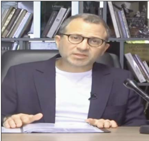
Պասիլ Նեյրի ՊԸՐՐԻԻ տեղեկատվական գրասենյակը հրապարակեց հետևեալ հարցազրույթը...