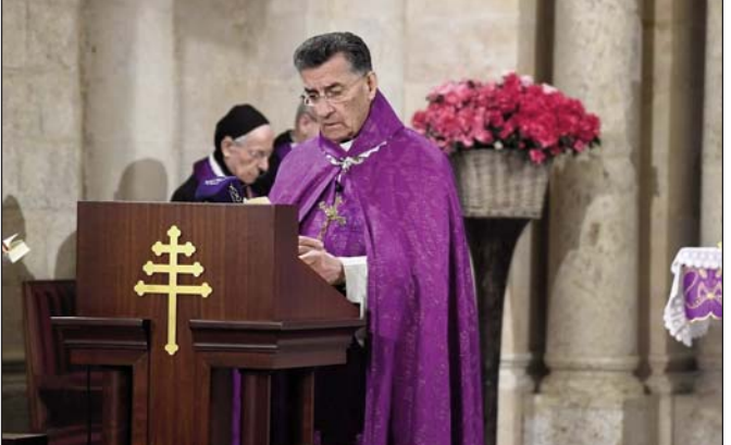
Մարոնի համայնքի Պշարա Ռայի պատրիարքը երկ Զարիսայի մեջ նախագահեց ՊԵՐՈՒՅԻ ՆԱԿԱԳԱԿԻՆ...