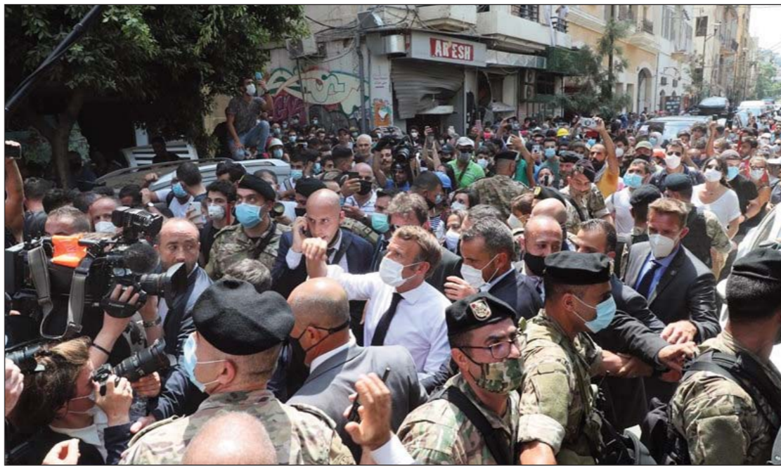
Շար.ը՝ էջ 2

Ապա Մաքրոն այցելեց Պեյրութի նաւահանգիստին պայթումին վայրը, ուր ծանօթացաւ արձանագրուած աղէտին տարրողութեան, ինչպէս նաեւ հետեւեցաւ հետաքննութեան եւ փրկարար աշխատանքներուն ընթացքին: