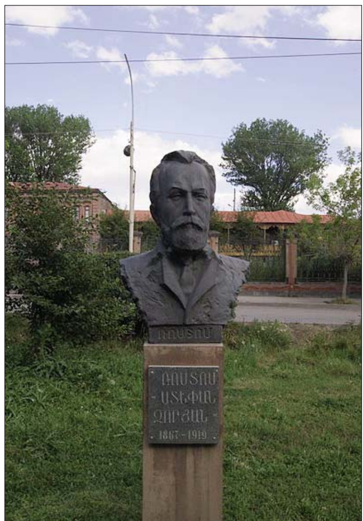
- Ռոստոմի կիսանդրին՝ Գիւմրիի Յաղթանակ զբօսայգիին մէջ: