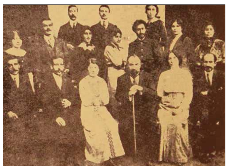
- Կարնոյ Հիփիսիմեանց դպրոցի ուսուցչական կազմը՝ դպրոցի տնօրէն Ռոստոմիսն հետ: