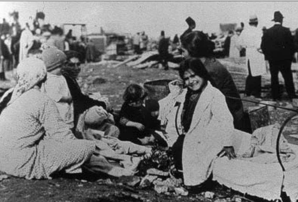
Վրանաքաղաքին աղէտեալները հրդեհին յաջորդ օրը

Եւ մէկ երկու ժամուան մէջ, մոխրացան մօտ 600 բնակարաններ եւ խուճապահար դուրս թափուեցան մեր 4000-ի մօտ դժբախտ հայրենակիցները, առանց անկողնի եւ տնական գոյքերու: Չարհուրելի աղէտը այնքան արագ եւ սաստկաշունչ տարածուեցաւ, որ հնարաւոր չդարձուց մեր խեղճ հայրենակիցներուն օգնութեան գործը: Տասնեակներով մեթր ղեպի եր-