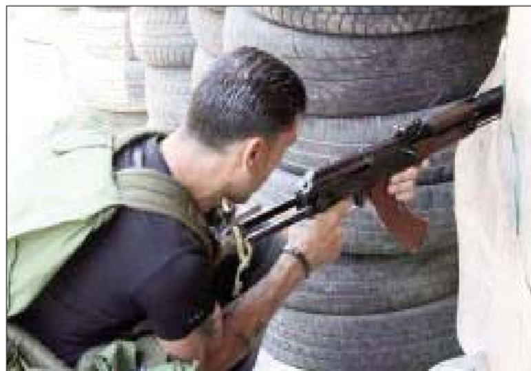
Նշեց սակայն, որ Թրիփոլի մէջ հաստատուած զինադուր լի փխրուն նկատուեցաւ՝ սպասելով Թրիփոլի պահպանական ուժերուն եւ ներքին գործոց նախարար Մարուան Շարպէլի միջեւ այսօր տեղի ունենալիք հանդիպումին:

Բանակի մասնախտուկ ուժեր շրջանէն դուրս բերին նաեւ չպայթած ռումբերն ու ձեռնառումբերը: