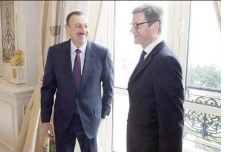
Վեստերուելլէ եւ Ալիւի Պաքոյի մէջ, մարտ 2012-ին

նադրամը եւ Կանաչներու կուսակցութեան անդամ երեսփոխան Կուլա վոն