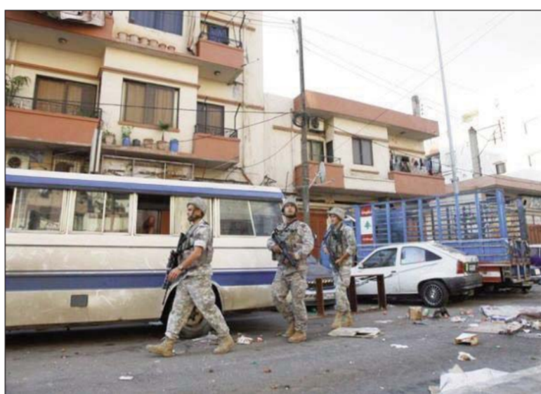
ձանագրուեցան Նաշար եւ Հաժեր ընտանիքներուն միջեւ:

Նշեց, որ նստացոյցին լոյսին տակ անհատական զինեալ բախումներ ար-