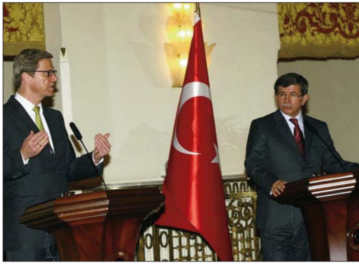
Վեսթերվելէ եւ Տաւութօղլու

Անդրադառնալով այն հարցին, թէ արդեօք Ֆրանսայի նոր նախագահ Ֆրանսուա Հոլլանտի՝ երկ նախատեսուած Գերմանիա այցելութեան ընթացքին պիտի քննարկուի՞ն Թուրքիա-Եւրոպական Միութիւն յարաբերութիւնները, ան