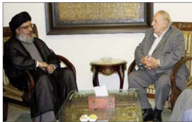
Նախագահ սեյիտ Իպրահիմ Ամին Սեյիտ:

Հրգպալլայի ընդհանուր քարտուղար սեյիտ Հասան Նասրալլա երէկ ընդունեց Պաղեստինի ազատագրութեան ազգային ճակատի ընդհանուր քարտուղար Ահմետ Շաբիրի, որուն ընկերակցեցան իր օգնականը՝ Թալալ Նաժի եւ Պաղեստինի ազատագրութեան ազգային ճակատի անդամներու պատուիրակութիւն մը: