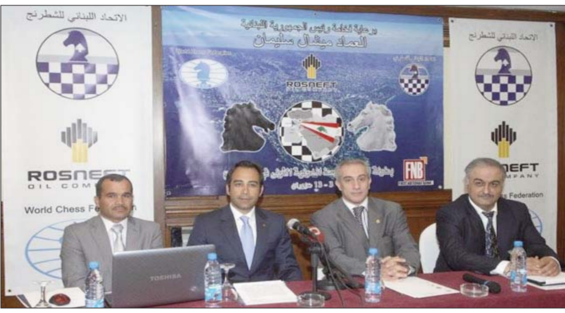
Տեղի ունեցած երեկուան մամոյ ասուլիսն

Երեկ կեսօրին, Պէյրուքի «Կոլտըն Թիվիփ» պանդոկին մեջ տեղի ունեցա յատուկ մամոյ ասուլիս մը, որուն ընթացքին պաշտօնապէս յայտարարուեցա, որ յառաջիկայ 3-13 յունիսին Լիբանանի պիտի հիւրընկալէ Միջին Արեւելքի ճատրակի առաջին անհատական ախոյեանութիւնը: Նշենք, որ տղոց եւ աղջկանց այս ախոյեանութիւնը տեղի պիտի ունենայ հովանաւորութեամբ նախագահ զօր. Միշել Սլէյմանի եւ նախագահութեամբ ՖիՏԵ-ի նախագահ Քիրսան Իլիոմփինովի: Այս ախոյեանութեան գլխաւոր իրաւարար նշանակուած է Չարլզ Զէյլ, իսկ անոր օգնականները յառաջիկային պիտի նշանակուին Լիբանանի ճատրակի ֆետերասիոնին կողմէ: Մասնակցութեան սակ ճշդուած է 100