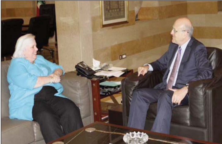
Դեսպան Զննելլի եւ վարչապետ Միշաթի

Միւս կողմէ, վարչապետ Միշաթի ընդունեց Լիբանանի մէջ Միացեալ Նահանգներու դեսպան Մորա Զննելլի, որուն հետ քննարկեց երկկողմանի յարաբերութիւնները, ինչպէս նաեւ շրջանային իրադարձութիւնները: