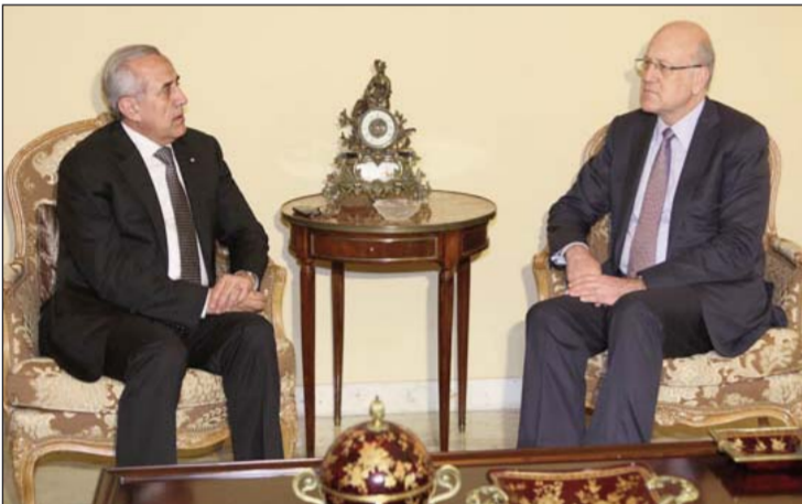
Նախագահ Սլեյման եւ վարչապետ Միշաթի

Վարչապետ Միշաթի նախագահը տեղեակ պահեց Թրիփոլիի մէջ տիրող կացութեան եւ ապահովութեան աստիճանական հաստատումին մասին: