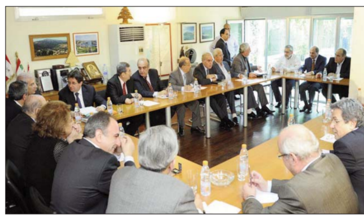
Անդրադառնալով 8,900 միլիարդ լ. ոսկիի թղթածրարին մասին վարչապետ Նեժիպ Միշաթիի կատարած յայտարարութիւններուն՝ Զանաան յայտնեց, որ անհրաժեշտ է ապահովել լիբանանցիներուն իրաւունքները: Ան աւելցնեց, որ Ռապիէի եւ Պալատայի միջեւ հեռաձայնային հաղորդակցութիւն չէ արձանագրուած:

Զանաան հաստատեց, որ երկրին ապահովական հարցերը կարելի է միայն օրինական կերպով լուծել՝ պահպանելով Թրիփոլիի եւ Լիբանանի ապահովական կայունութիւնը: Անդրադառնալով ելեւմտական թղթածրարին լուծման՝ Զանաան յայտնեց, որ այդ լուծումը կարելի է ապահովել արտակարգ կերպով եւ առանց վնաս հասցնելու լիբանանցիներուն շահերուն: